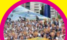
お祭りダンスサークル 祭楽人