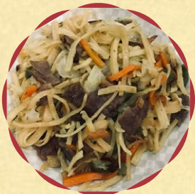
ツォイワン (焼きうどん)