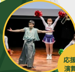
応援団の 演舞あり

1971年大阪府吹田市生まれ。89年大阪大学基礎工学部生物工学科に入学。大学時代は軽音楽部SWINGでトランペットを吹いていた。95年大阪大学大学院基礎工学研究科物理系生物工学専攻を修了し、科学技術庁へ入庁。その後、文部科学省、経済産業省、内閣府等で科学技術政策に従事。プライベートでは、動物園マニアとして活動。NPO法人市民ZOOネットワーク元代表理事。2006年には、テレビ東京・TVチャンピオン「動物園王選手権」で優勝。大阪市の公募に応じ、14年7月より大阪市建設局動物園改革担当部長、15年4月より天王寺動物園長を兼務。