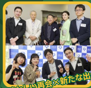
懐かしい再会と新たな出会い

卒業・修了 5 周年 2014年4月~2015年3月卒業・修了の方 参加費 1,000円でご招待!