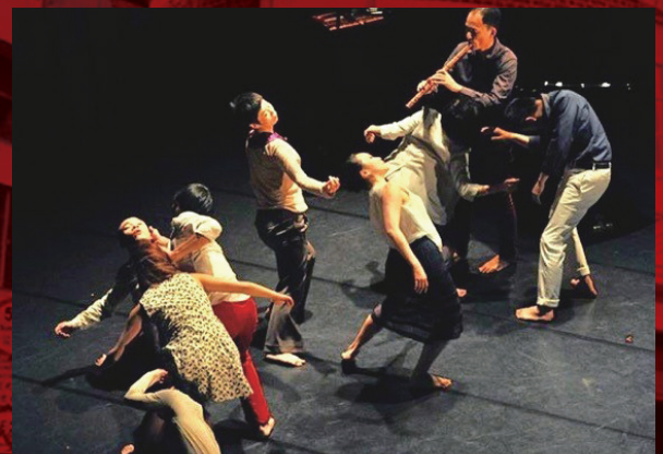
林文中舞踊団『小南管Ⅱ』公演より

1970年代以降、日本を含むアジア演劇は西欧演劇との関係を変容させ、またアジア域内での交流も活発化させてきています。ポスト・グローバルの時代を迎えるこれからの日本社会のあり方、アジアや西欧への向き合い方について触れながら、この間の日本を含むアジア演劇の独自の動きを現代演劇史の中に位置づけていきます。