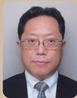
板倉 康洋 (いたくら やすひろ)

文部科学省科学技術・学術政策局 局長 1987年京都大理学部卒。同年科学技術庁入庁。 東京農工大教授、文部科学省研究振興局ライフサイエンス課長、日本医療研究開発機構経営企画部長、文部科学省大臣官房審議官等を経て、2020年7月から現職。