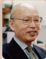
相澤 益男 (あいざわ ますお)

文部科学省科学技術・学術政策局 局長 1987年京都大理学部卒。同年科学技術庁入庁。 東京農工大教授、文部科学省研究振興局ライフサイエンス課長、日本医療研究開発機構経営企画部長、文部科学省大臣官房審議官等を経て、2020年7月から現職。